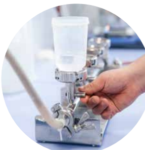
Apparatur für die Membranfiltration in der Mikrobiologie

Die Wasserhärte beeinflusst nicht nur die Wirksamkeit von Waschmitteln, sondern auch die Lebensdauer von Haushaltsgeräten wie Waschmaschinen und Geschirrspülern.