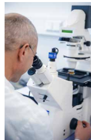
Mikroskopische Untersuchung einer Probe

Geringe Zugabemengen von Desinfektionsmitteln stellen sicher, dass keine hygienisch relevanten Bakterien die Wasserwerke verlassen. Die Desinfektionsmittelmengen sind so eingestellt, dass diese beim Kunden nicht mehr wahrnehmbar sind.